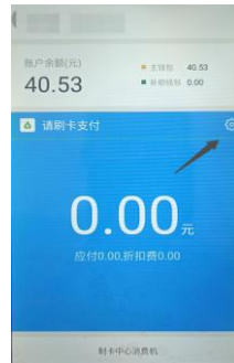
图 2. 点击左侧屏幕箭头指向位置根据提示操作