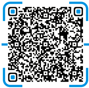
图 1. 扫描二维码，查询个人学号或工号