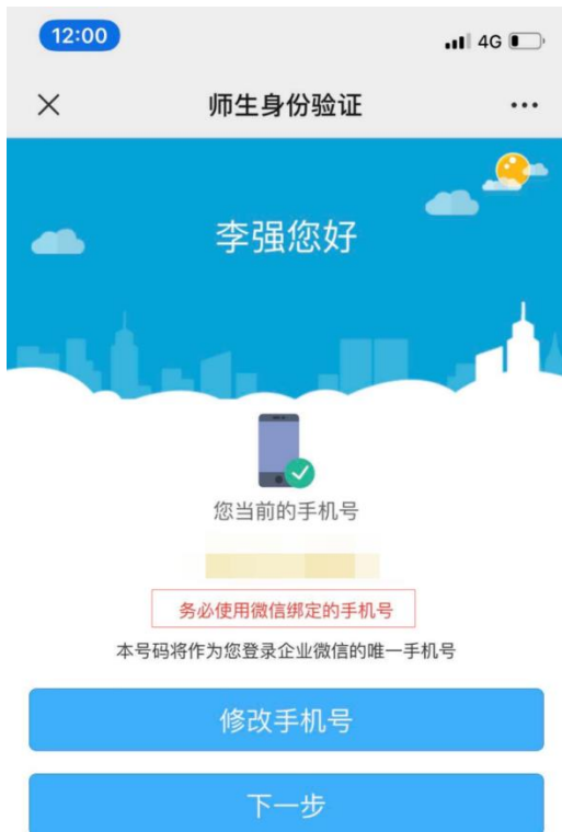
图 5. 填写或修改手机号码 (务必使用该微信绑定的手机号码)