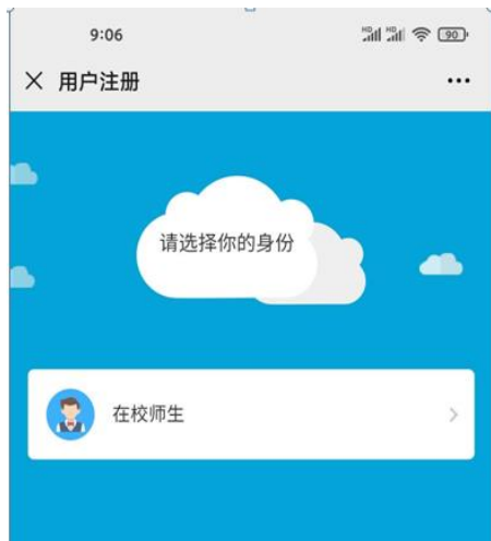
图 3. 选择身份