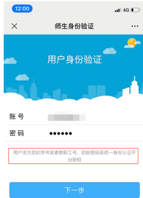
图 4. 输入帐号和密码 (帐号是您的学号/工号, 初始密码为 Jnmc@#身份证后六位, 例如 Jnmc@#013635, 末尾是字母的, 请使用大写 X), 验证用户身份